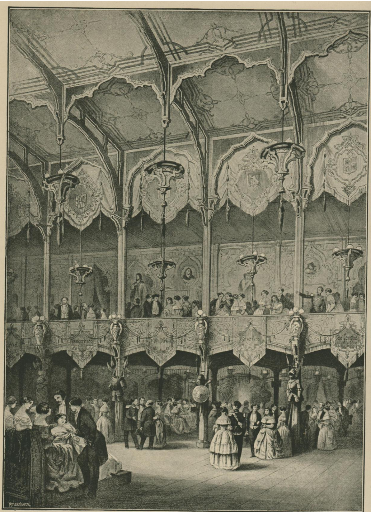
FÊTE D'INAUGURATION DU MARCHÉ DE LA MADELEINE, 26 SEPTEMBRE 1848. GALERIE MAURESQUE DE LA PARTIE CENTRALE (Balat, architecte). D'après la lithographie de Huard et Lauters.